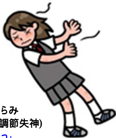
立ちくらみ (神経調節失神) 「ふーっ」

めまい(眩暈、げんうん)という字の中の、【眩】は「くらみ」(強い光・炎・対向車のライトなどで明順応が遅れ視力が低下すること。転じて立ちくらみ時の網膜・後頭葉虚血による眼前暗黒)、【暈】は「ぼやけ」(太陽・月の周囲の光学的な傘/ハロー現象のこと。転じて眼前のぼやけ、転じて目舞ひ・物がぐるぐる回ったり揺れ動いたり)と言われます。すなわち、めまい(という日本語、英語も同様です)には2種類あることにご注意下さい