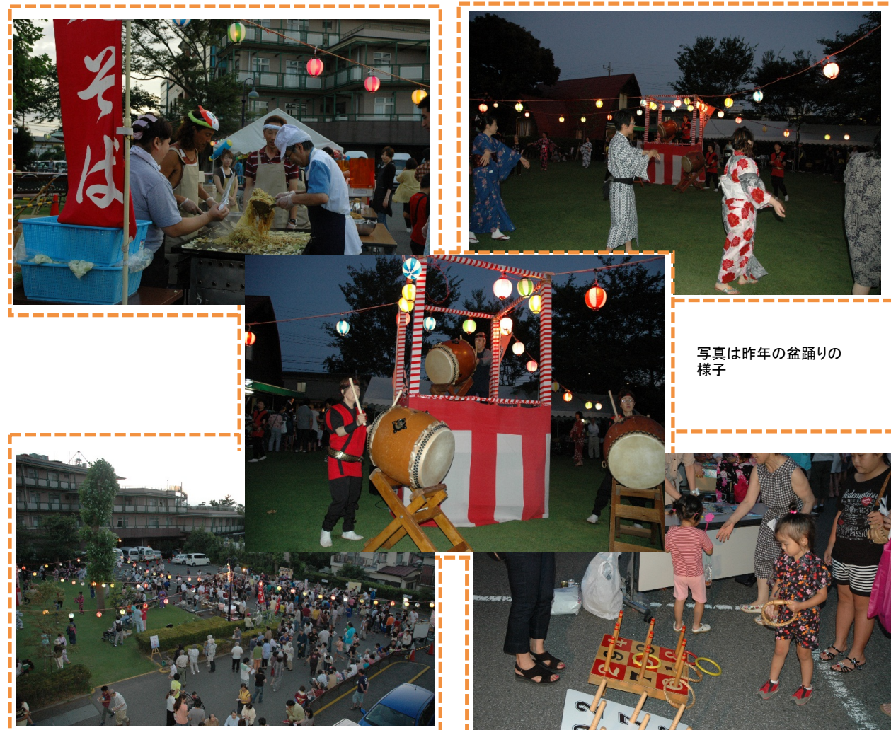
写真は昨年の盆踊りの様子