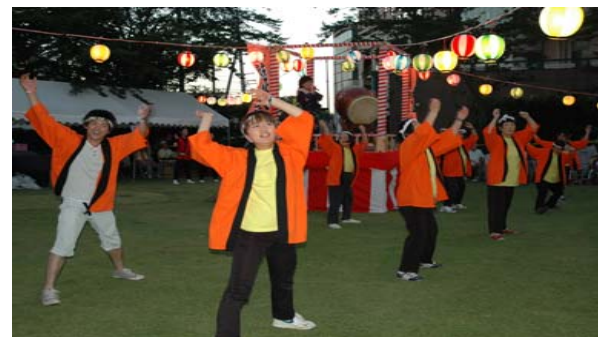
写真右上より、同和会バンドの演奏（クリスマス会）、作業療法の合唱プログラム、「音楽祭」でのサクソ演奏、「盆踊り」でのソーラン節演舞