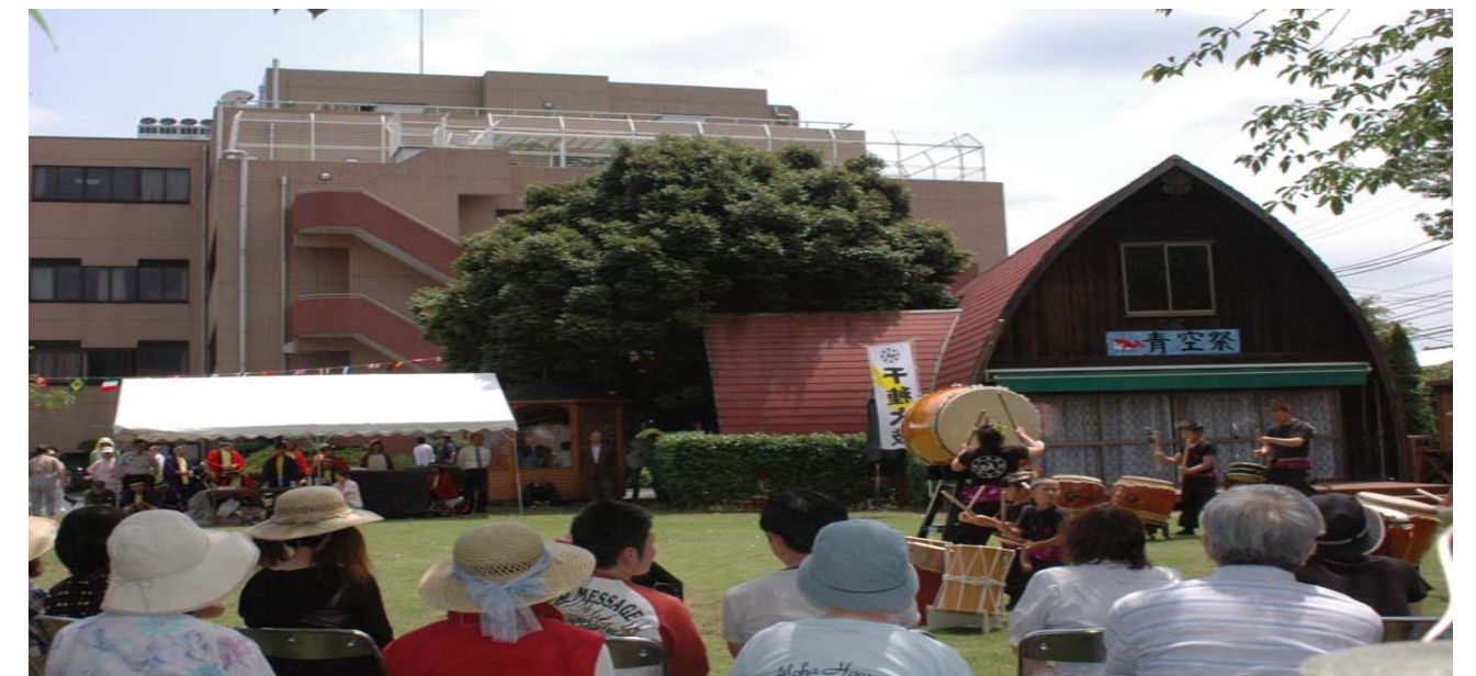
青空まつりの様子 (晴天時はお祭り広場で行います)