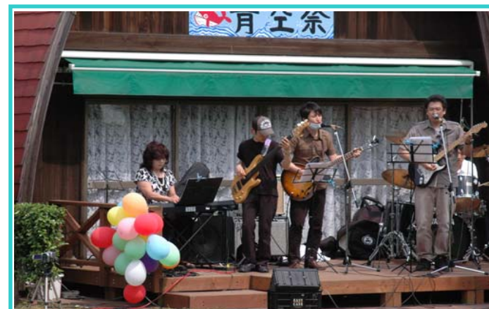
“同和会バンド”による演奏

主治医の指示が必要です。 なお、見学は随時行っていますので、お気軽にデイケア・スタッフまでご相談ください。 費用については、公費負担による自立支援医療制度を利用することができます。自立支援医療制度については、主治医・地域生活支援室などにご相談ください。