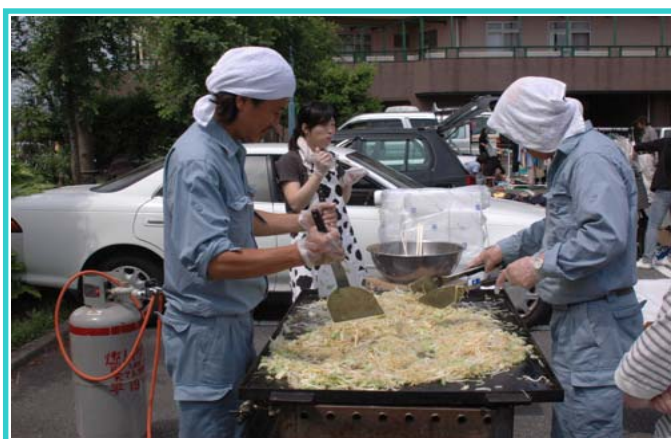
千葉病院名物？の焼きそば