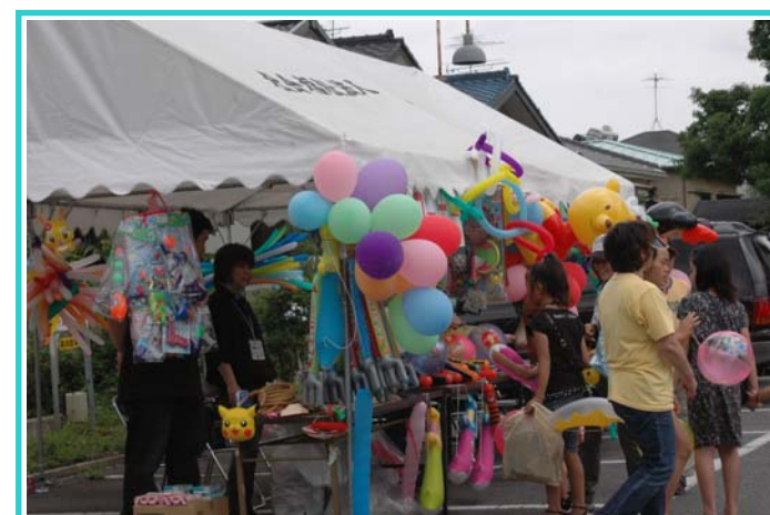
屋台の出店もあります